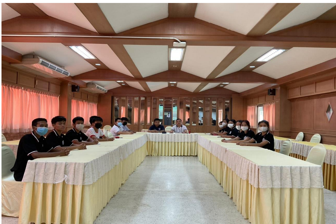
ภาพ 5 แสดงการประชุมวางแผนภาคีเครือข่ายกับทีมงาน ศอ.ปส.ย. จังหวัดเพชรบูรณ์และนักเรียนแกนนำ GenZ และ แกนนำ C.Y.D.O.T โรงเรียนเพชรพิทยาคม