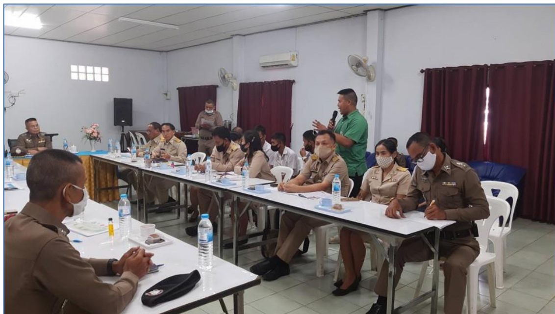
ภาพ 1 แสดงการประชุมวางแผนภาคีเครือข่ายกับเจ้าหน้าที่สถานีตำรวจภูธรเมืองเพชรบูรณ์

P คือ Plan การวางแผน ได้จัดประชุมคณะกรรมการบริหารงานป้องกันและแก้ไขปัญหายาเสพติด กลุ่มบริหารกิจการนักเรียน ในการรายงานพฤติกรรมนักเรียนกลุ่มเสี่ยงและการเขียนโครงการเพื่อพัฒนานักเรียนแกนนำ และจัดให้มีการประชุมภาคีเครือข่ายหลายหน่วยงาน อาทิเช่น ศอ.ปส. อำเภอเมือง เจ้าหน้าที่ตำรวจ ทีมงานศูนย์คัดกรองโรงพยาบาลเพชรบูรณ์