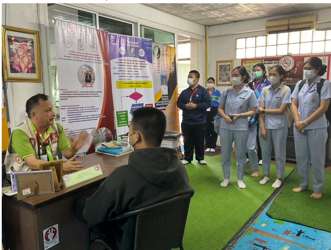
ภาพ 17 แสดงภาพขณะศึกษาดูงานจากทีมศูนย์คัดกรอง โรงพยาบาลเพชรบูรณ์และ นักศึกษาคณะพยาบาล วิทยาลัยพยาบาลบรมราชชนนี อุตรดิตถ์

ได้ใช้รูปแบบหรือกระบวนการ“GenZ และ C.Y.D.O.T. กับการจัดการเชิงรุก ด้านการป้องกันและแก้ไขปัญหามั่วสุมหรือ แอลกอฮอล์และยาเสพติด” Innovation : GenZ and C.Y.D.O.T. with Proactive Management in the prevention and correction of cigarette problems Alcohol and drungs. กับชุมชน โดยใช้ในการช่วยเหลือนักเรียนกลุ่มเสี่ยงภายในชุมชนของโรงเรียนและผู้ปกครองเข้าใจในรูปแบบการดูแลนักเรียนกลุ่มเสี่ยงให้กลับมาเป็นนักเรียนปกติได้อย่างสมบูรณ์ และนอกจากนี้ยังมีคณะหน่วยงานขอเข้าศึกษาดูงานตามกระบวนการ อาทิเช่น นักศึกษาคณะพยาบาลวิทยาลัยพยาบาลบรมราชชนนี อุตรดิตถ์ และ โรงเรียนศรีจันทร์วิทยาคม รัชมังคลาภิเษก