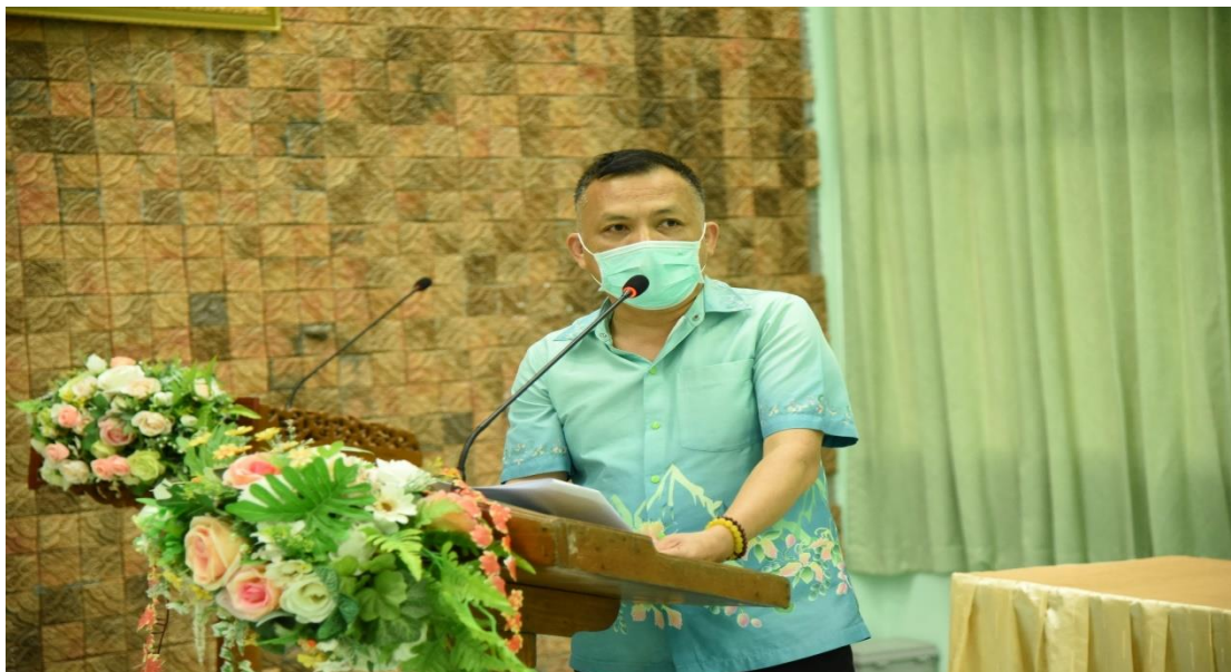
ภาพ 13 แสดงภาพการประชุมครูและบุคลากรทางการศึกษา เพื่อรับฟังแสดงความคิดเห็น

C คือ Check ตรวจสอบ ได้ทำการตรวจสอบรูปแบบการดำเนินงานช่วยเหลือนักเรียนกลุ่มเสี่ยงโดยนำเสนอรูปแบบกระบวนการ GenZ และ C.Y.D.O.T. กับการจัดการเชิงรุก ด้านการป้องกันและแก้ไขปัญหายาสูบ ตรี แอลกอฮอล์ และยาเสพติด GenZ and C.Y.D.O.T. with Proactive Management in the prevention and correction of cigarette problems Alcohol and drugs. ให้กับคณะผู้บริหาร คณะครูและบุคลากรทางการศึกษา ได้รับทราบถึงรูปแบบการดำเนินงาน อีกทั้งนำเสนอให้คณะศึกษาดูงานได้รับทราบและมีโอกาสรับการแสดงความคิดเห็นจากกลุ่มเหล่านั้น