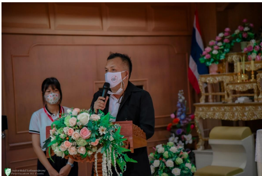
ภาพ 15 แสดงภาพนำเสนอให้คณะศึกษาดูงานทราบรูปแบบและเพื่อรับฟังแสดงความคิดเห็น