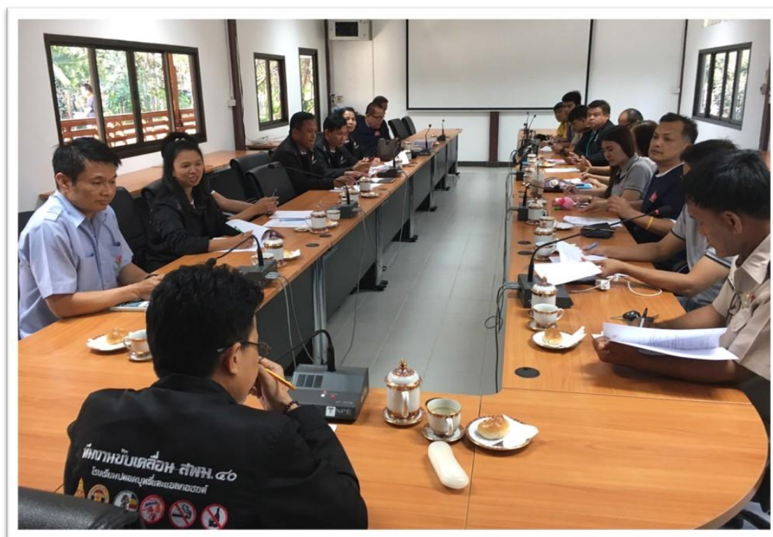
ภาพ 3 แสดงการประชุมวางแผนภาคีเครือข่ายกับคณะครูทีมงานแกนนำ สพม.เพชรบูรณ์และ สำนักงานควบคุมโรคที่ 2 พิษณุโลก