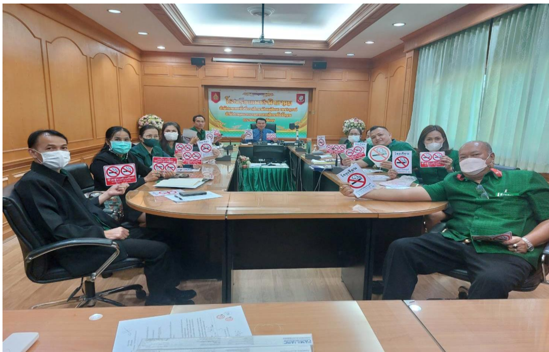
ภาพ 7 แสดงการประชุมวางแผนภาคีเครือข่ายกับคณะกรรมการบริหารงานป้องกัน และแก้ไขปัญหายาเสพติด กลุ่มบริหารกิจการนักเรียน