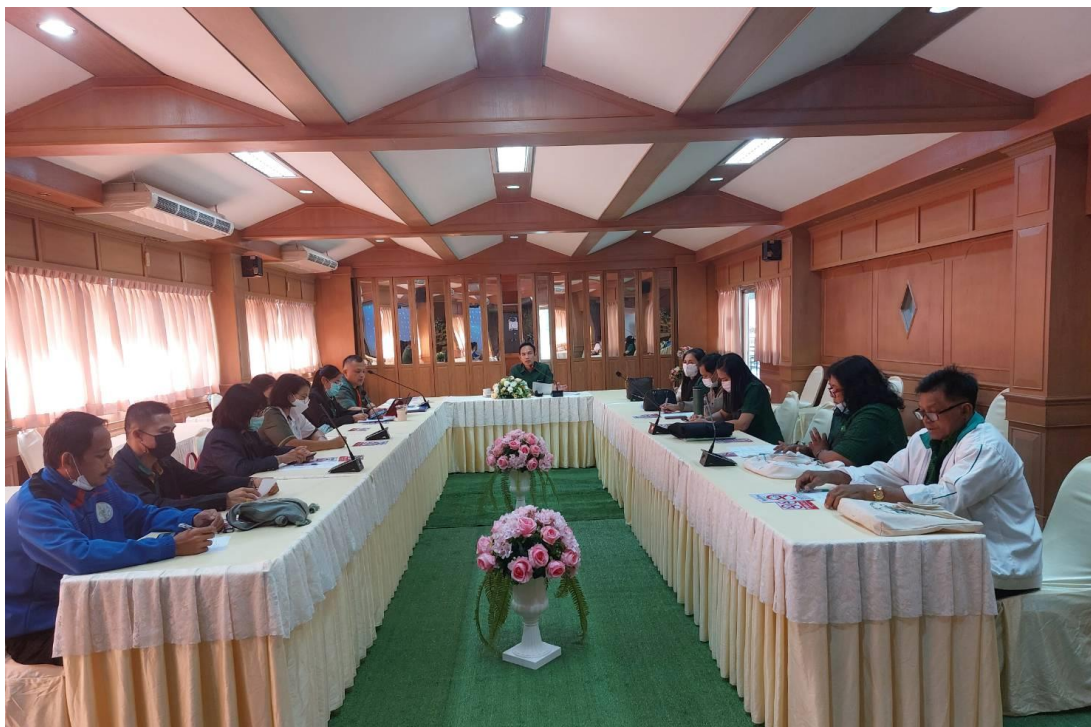
ภาพ 6 แสดงการประชุมวางแผนภาคีเครือข่ายกับตัวแทนคณะครูทุกระดับชั้น