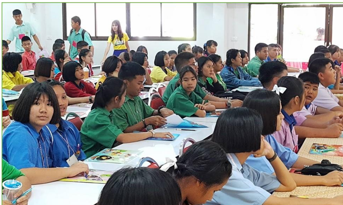
ภาพ 2 แสดงการประชุมวางแผนภาคีเครือข่ายนักเรียนโรงเรียนในเขตอำเภอเมืองเพชรบูรณ์ กับเจ้าหน้าที่ศูนย์คัดกรองโรงพยาบาลเพชรบูรณ์