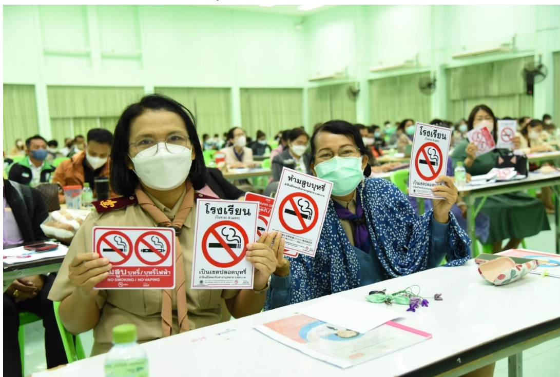
ภาพ 14 แสดงภาพการประชุมครูและบุคลากรทางการศึกษา เพื่อรับฟังแสดงความคิดเห็น