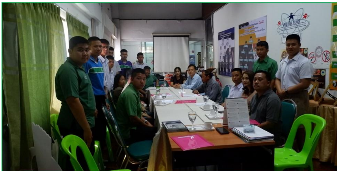
ภาพ 4 แสดงการประชุมวางแผนภาคีเครือข่ายกับผู้นำท้องถิ่น