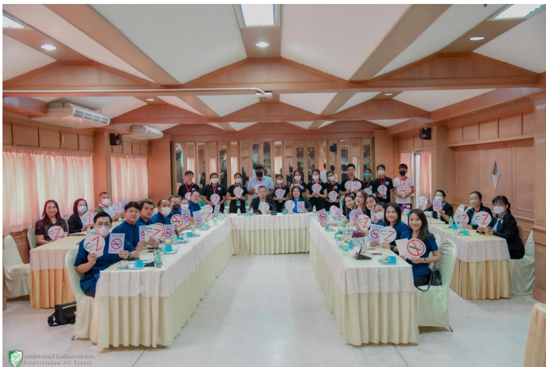
ภาพ 16 แสดงภาพนำเสนอให้คณะศึกษาดูงานทราบรูปแบบและเพื่อรับฟังแสดงความคิดเห็น