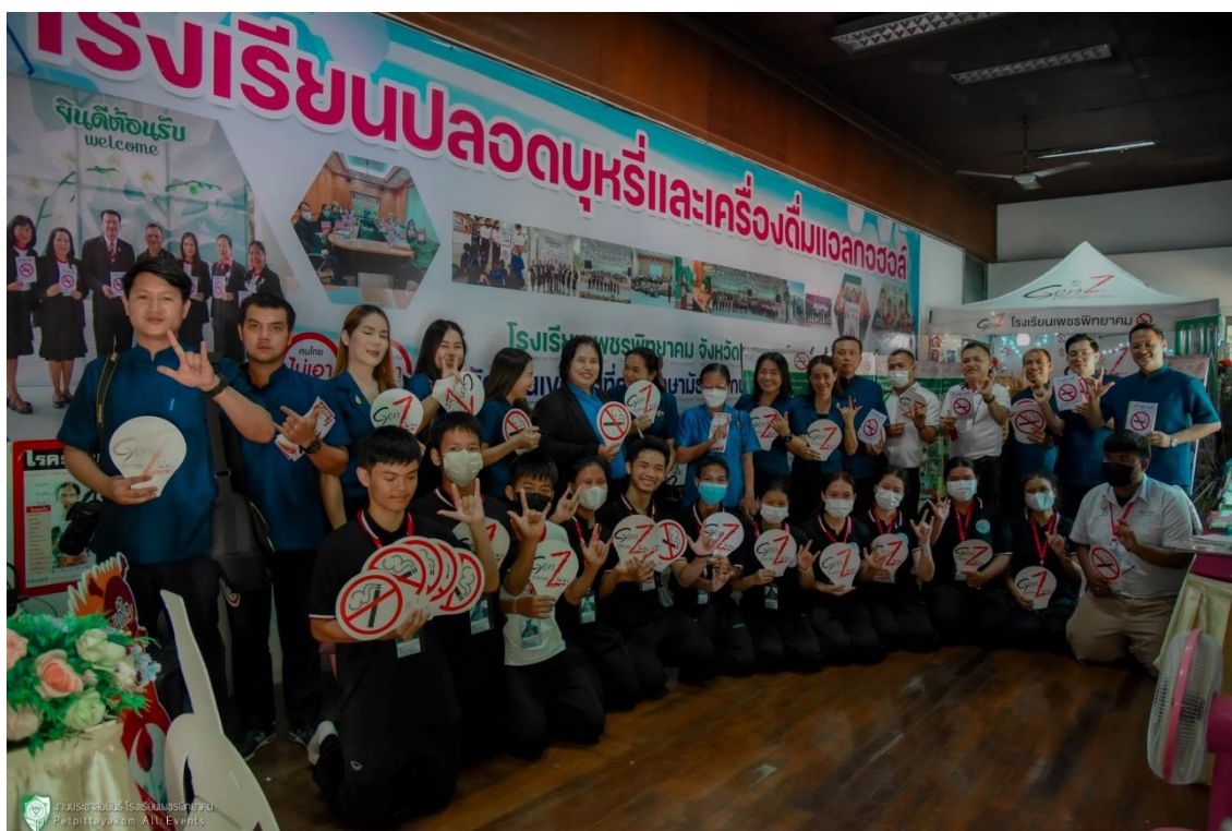
ภาพ 18 แสดงภาพคณะศึกษาดูงานจากโรงเรียนศรีจันทร์วิทยาคม รัชมังคลาภิเษก